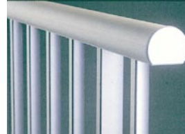
Main courante ronde