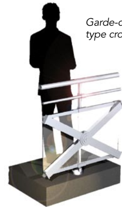
Garde-corps droit type croix St-André