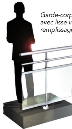
Garde-corps droit avec lisse intermédiaire remplissage