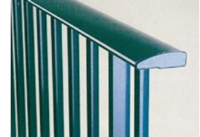
Main courante design