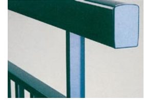
Main courante haute