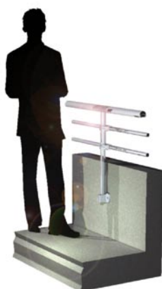
Garde-corps droit type paquebot Fixation sur muret