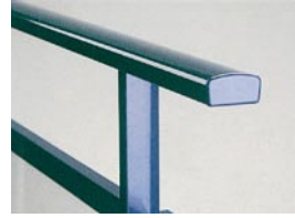
Main courante basse