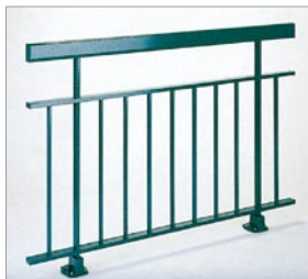
Garde-corps à barreaudage avec lisse intermédiaire